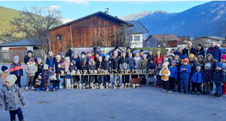
88 Schafe für die Obtârrenzer Krippe wurden heuer gebastelt

Am 19. November hat nach zwei Jahren endlich wieder gemeinsam mit den Kindern das „Schafle baschtle“ in Obtârrenz stattgefunden.