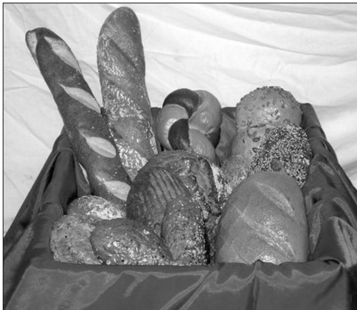
Vielfältig und schmackhaft - Brot vom Bäcker

Etwas Neues hat sich die Bäckerei Eder einfallen lassen. Unter dem Motto "Brot für Körper und Geist" wird nun jedes Monat zusätzlich ein spezielles Brot gebacken.