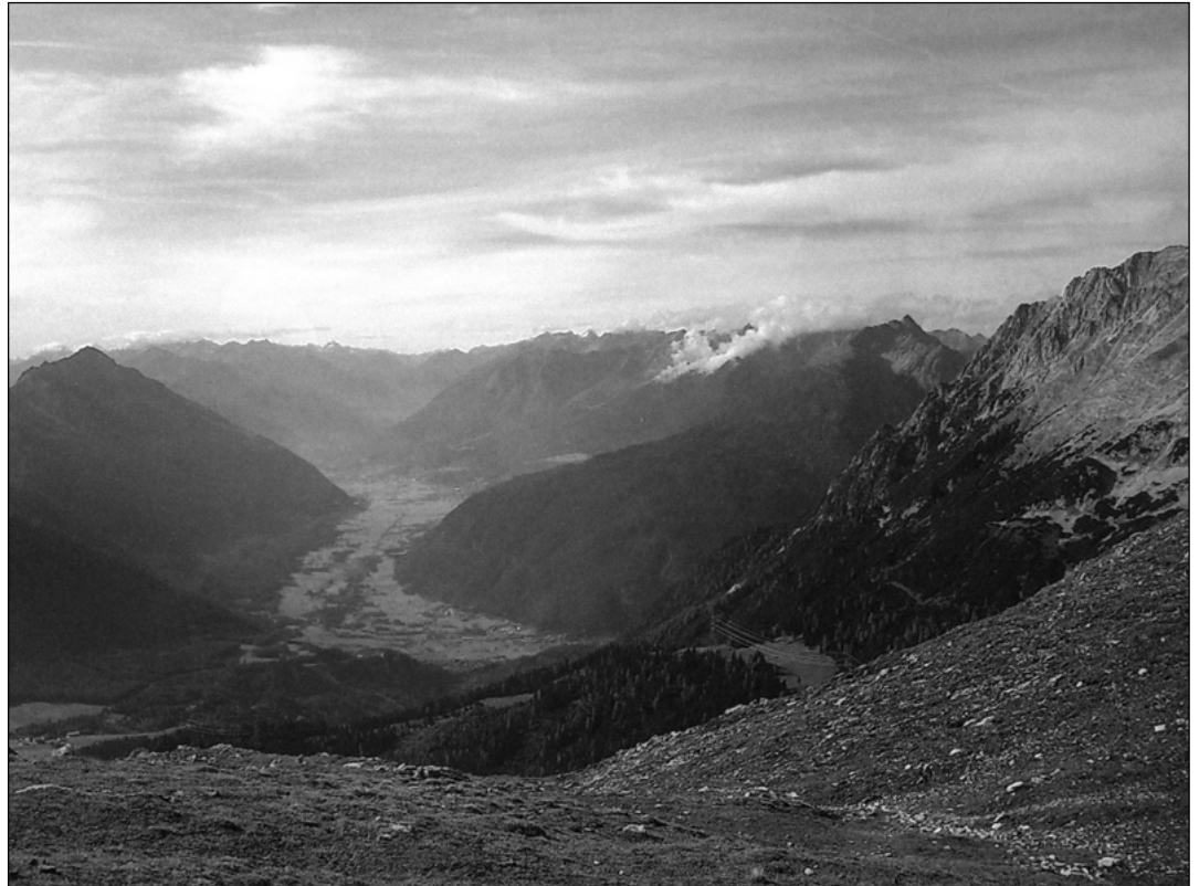
Blick ins Gurgltal, links der Tschirgant

Termin: Samstag, 18. Juni Treffpunkt: 7:00 Uhr am Dorfplatz Tarrenz Tourenverlauf: Karrösten, Karröster Alm, Gipfelkreuz 2370 m Gehzeit: ca. 6-7 Stunden Kosten: 10 € Anmeldeschluss: 16. Juni