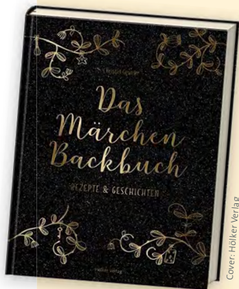
Cover: Holker Verlag

Diesen Monat solltet ihr euch unbedingt von Christin Gewekes Märchenbackbuch verzaubern lassen. Die Autorin verführt in ihrem Backbuch mit wunderbarem Backwerk – von Blaubeer-Clafoutis und Schwarzwälder-Kirsch-Trifle, über Schokoladen-Bourbon-Cupcakes und Tiramisutorte bis hin zu Bratapfel-Tarte-Tartin und Lavaküchlein werden dem Naschkatzenherzen alle Träume erfüllt. Zugleich versüßen die fünf ausgewählten Märchen der Wartezeit bis die Köstlichkeiten vernascht werden können. Zusätzliche Highlights sind der glitzernde (!) Einband und die von der Fotografin Yelda Yilmaz perfekt in Szene gesetzten Leckereien. Als kleines Sahnehäubchen darf Sterntalers Kokostorte bei der Jubiläumslesung in der Bibliothek Tarrenz verkostet werden! [nina]