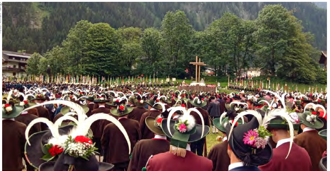
Eine Farbenpracht bildeten die zahlreichen bunten Trachten der Alpenregion.