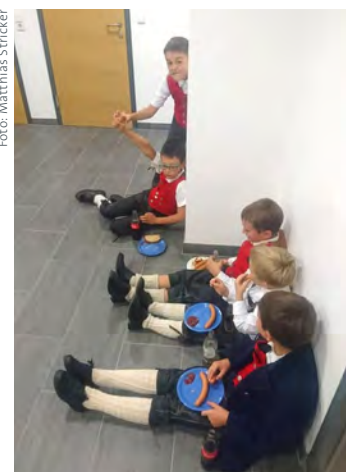
Die Marend danach ...