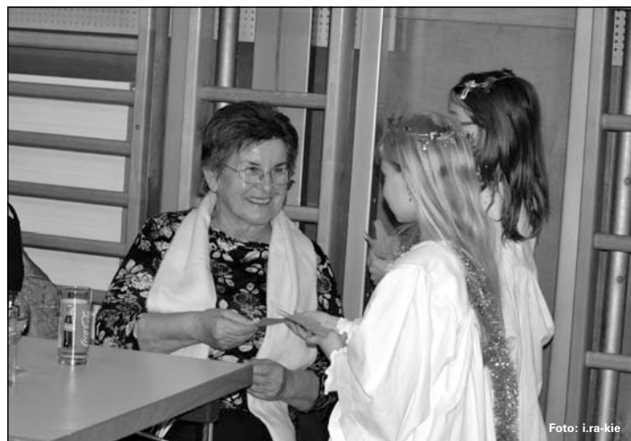
Die Volksschul-Weihnachtsgel beschenken die Anwesenden mit einem kleinen Weihnachtsgruß