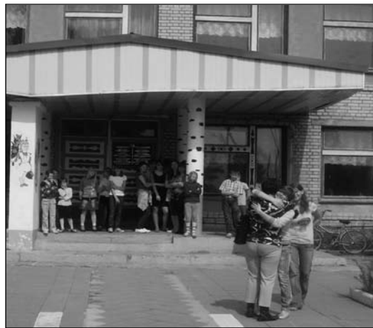
zu Besuch in Belarus