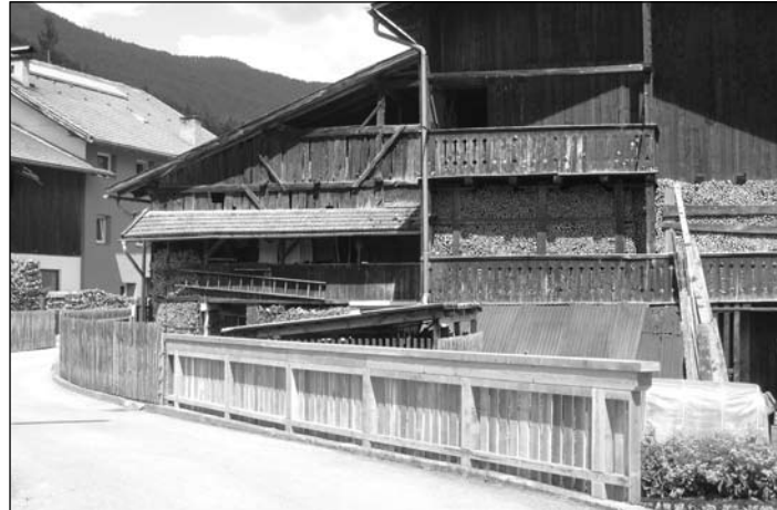
alter Weg, neues Drumherum