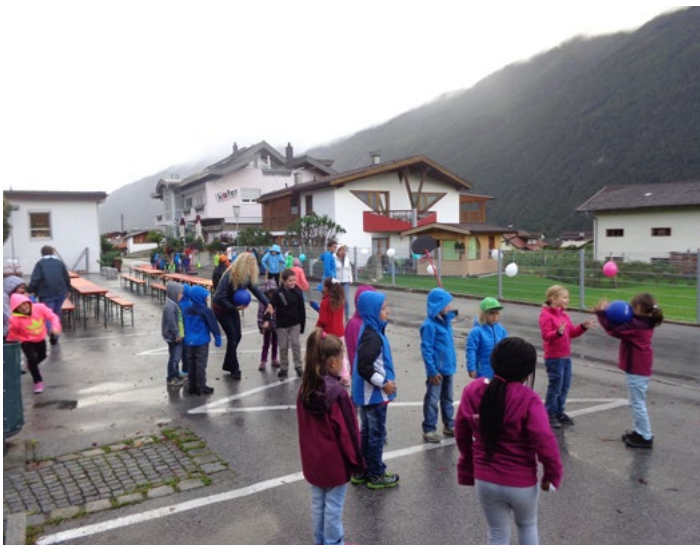
Ein etwas anderer Schultag – der autofreie Tag in Tarrenz

Zumindest am Vormittag des 22. September 2014 hat die Straße uns gehört, weil auch die Gemeinde Tarrenz (seit heuer Klimabündnisgemeinde) beim europaweiten „Autofreien Tag“ teilgenommen hat. Die Straße vor unserer Schule war gesperrt, und so konnten wir dort spielen, turnen, malen und essen. Viele fleißige Mamas ha-