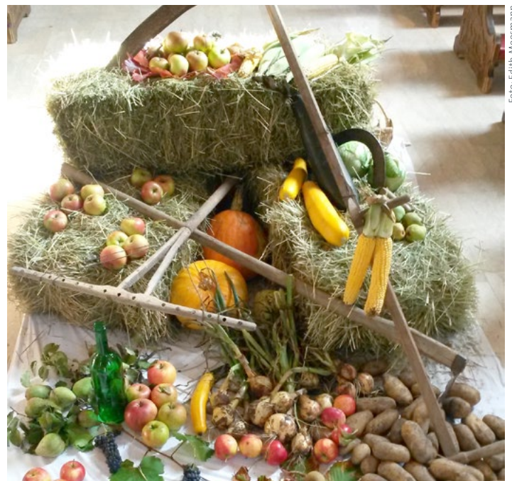
Vielen Dank unseren Jungbauern für die schöne Gestaltung der Kirche und für die Agape am Erntedankfest.