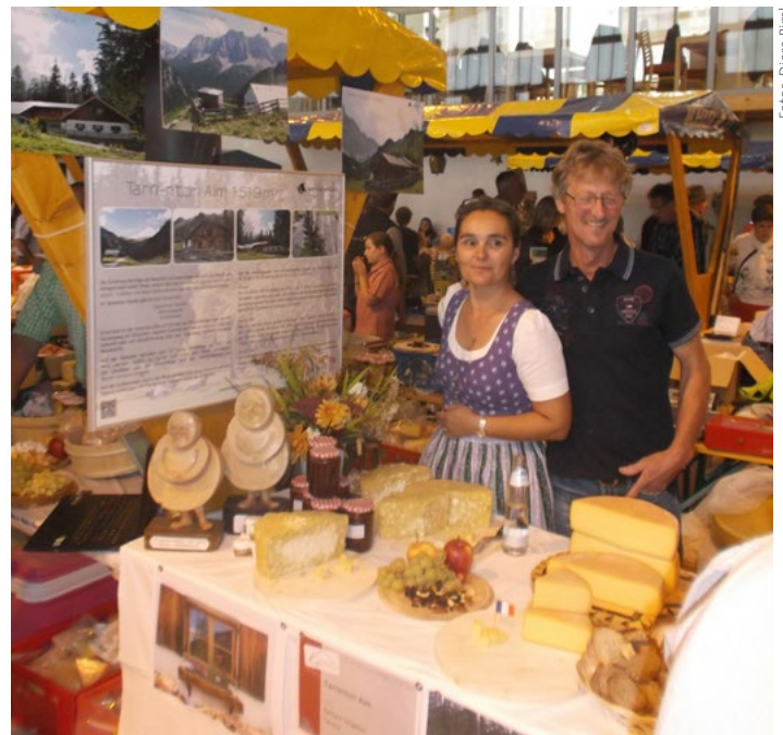
Die gesamte Almregion Tarrenton wurde auf dem Stand bei der Almkäseolympiade in Galtür präsentiert

ausgezeichnet. Insgesamt vergab die Jury 37 Sennerharfen in Gold, 26 in Silber und 37 in Bronze. Der Ausschuss der Alminteressenschaft Tarrenton freut sich sehr und gratuliert recht herzlich!