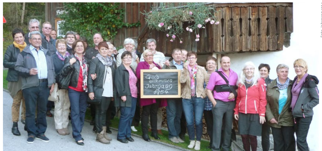
Foto: Jahrgang 1954