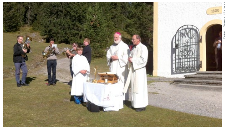
Die letzte Sinnesbrunnwallfahrt am 12. Oktober mit dem Weihbischof Andreas Laun aus Salzburg.