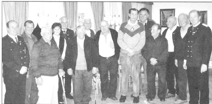
Die "30-60-jährigen" Jubilarer