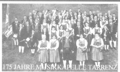
175 JAHRE MUSIKKAPELLE TARRENZ

20:30-21:30 HAPPY HOUR-BAR 21:30 J U K E B O X