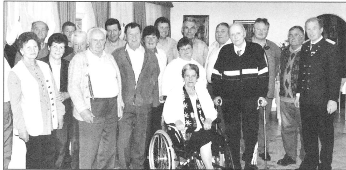
Die "25-jährigen" Mitglieder

Anlässlich der heurigen Jahreshauptversammlung wurde tief in den Archiven der Gilde gestöbert.